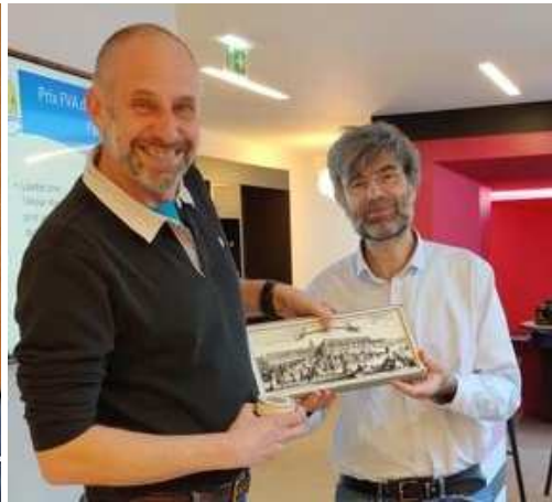
Award van de Franse Fédération Voile-Aviron