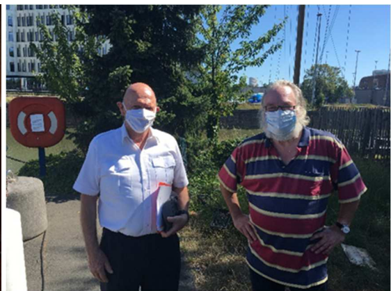
... evenals honderden uren studie en externe expertise om het want op punt te stellen

Onze beloning : de waardering van onze boten en de glimlach van de jongeren !