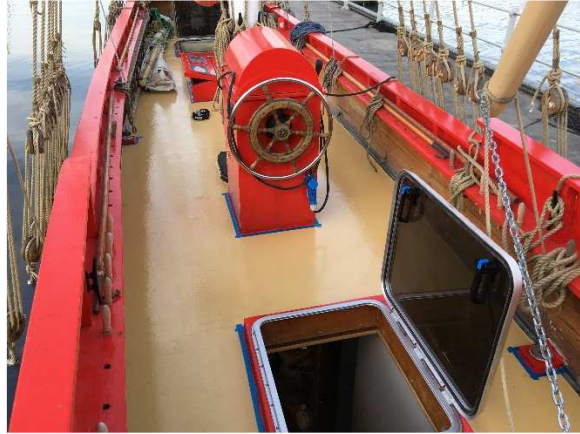
Binneninrichting en dekwerken aan de Eenhoorn