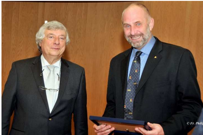
Award van de Belgische Maritieme Liga