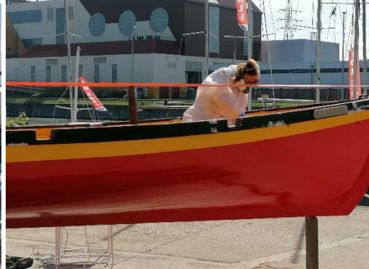
Renovatiewerken aan Penguin, Uilenspiegel en Javelot