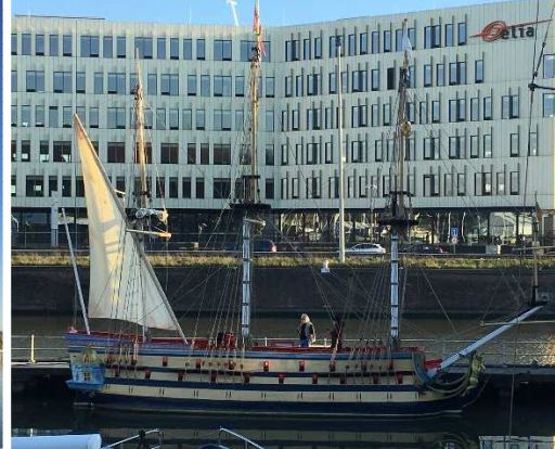
Installatie van de vier eerste zeilen