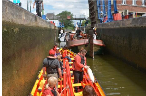
Roetrips op het kanaal en Raid afvaart van de Samber