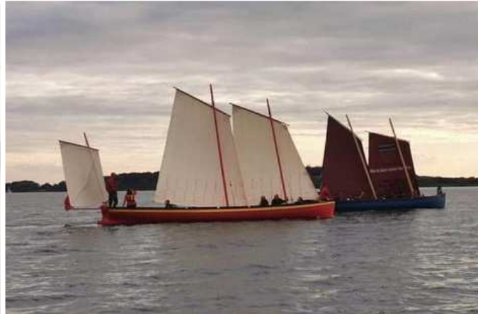
Roei- en zeilstages op de Lac d'Orient te Troyes (F)