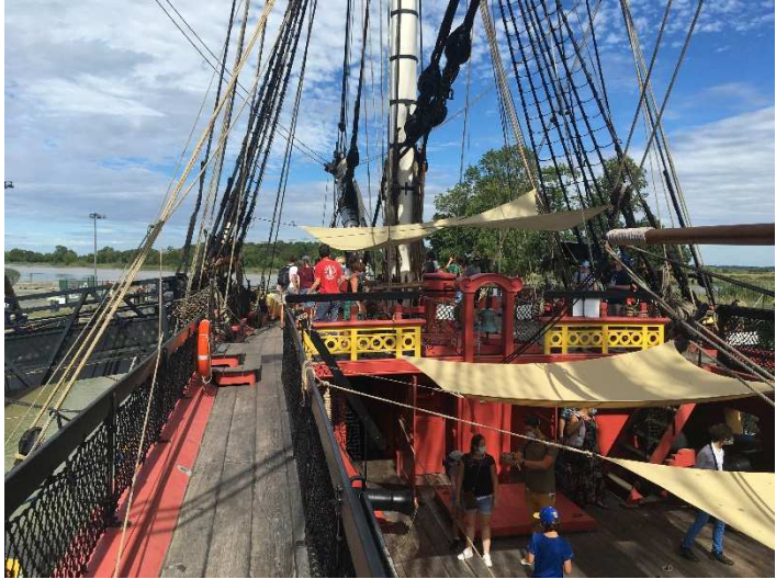
Studiereis naar het fregat l'Hermione te Rochefort...