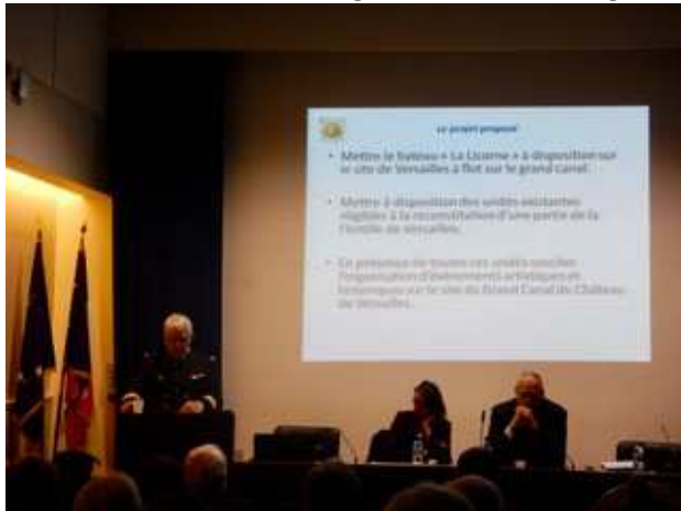
Lezing aan de Parijse Académie de Marine over de Koninklijke Flottille van Versailles